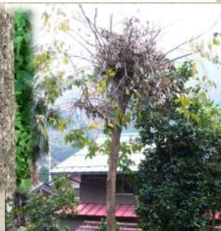
カキの木に残るクマ棚