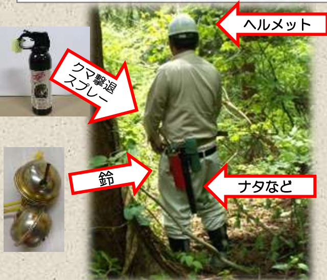
クマに対する備え

クマを避ける配慮と同時に、遭遇した際に被害を小さくする備えをする必要があります。過去の事例から頭部や顔面などへの攻撃が多いため、ヘルメットを着用するなど、被害の低減に努める必要があります。また、襲われる瞬間は防御姿勢をとり、顔面などに攻撃を受けないように注意してください。その他、クマ撃退スプレーを携行し、攻撃を受ける前にスプレーをクマの顔面へ噴射するなど、より積極的な防御が必要です。(子連れの場合、鈴やラジオを携行していても、襲われた事例があります。)