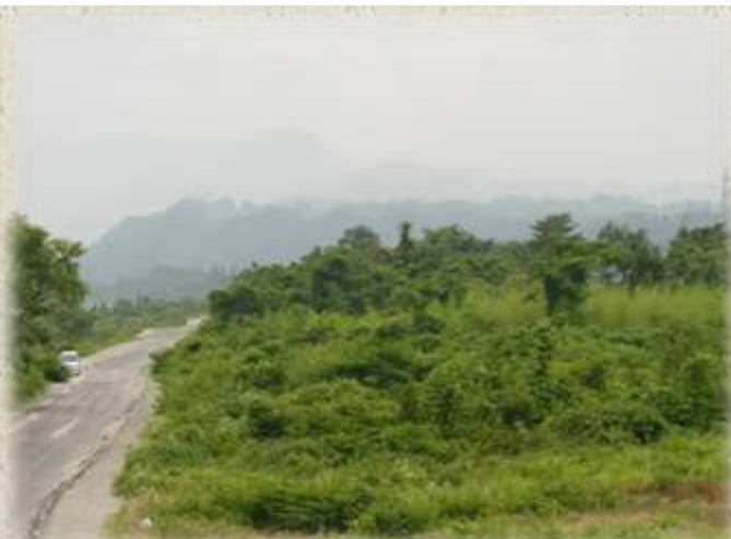
河川敷のヤブや河畔林などを移動

近隣でクマの情報があった場合は、不要不急の外出は控え、屋内や車の中などへ避難してください。