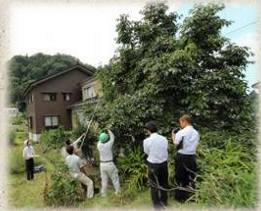
早めにカキの実の除去を行う。

近年、里山地域でもクマの生息が確認されていることから、山際の集落ではクマの情報に注意すると共に、誘引物の除去に取り組んでください。