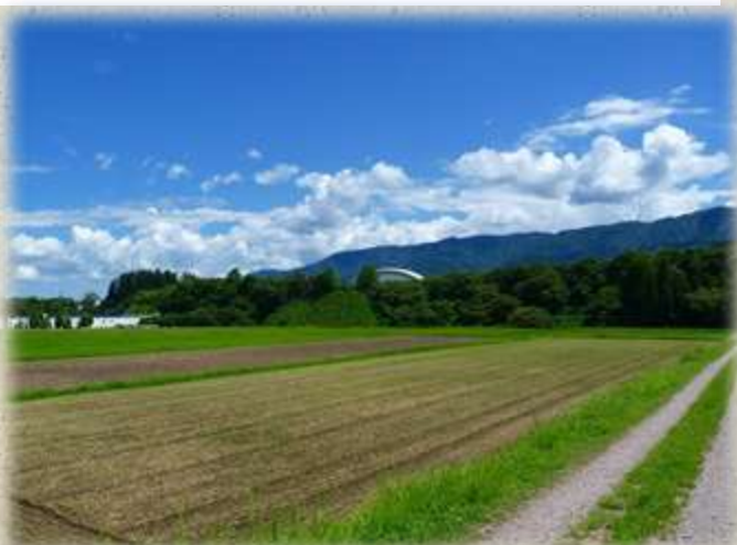
河岸段丘の林などを移動